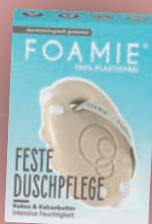
FOAMIE 2IN1 FESTES DUSCHGEL KOKOS 80 g Packung