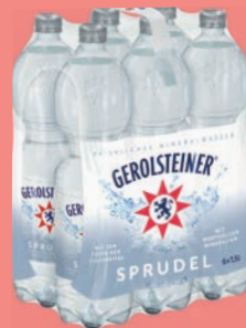
GEROLSTEINER MINERALWASSER 6 x 1,5 l | PET EW

Die richtige Kombination aus Flüssigkeit, Elektrolyten und proteinreichem Snack unterstützt dich rund um dein Training – für mehr Energie, bessere Regeneration und einen starken Neustart.