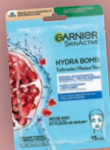
GARNIER HYDRA BOMB TUCHMASKE GRANATAPFEL 28 Stk. Packung