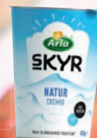
ARLA SKYR NATUR 450 g Becher