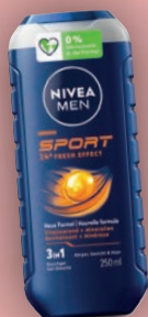
NIVEA MEN SPORT 24H FRESH EFFECT 3IN1 250 ml Flasche