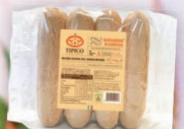
TIPICO LÖFFELBISKUITS 50% FRISCHEI 350 g Packung