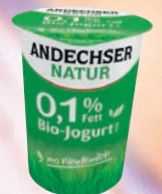
ANDECHSER BIO JOGHURT MILD MIT 0,1% FETT 500 g Becher