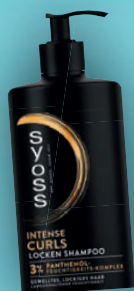
SYOSS SHAMPOO INTENSE CURLS 440 ml Flasche