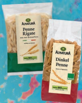
ALNATURA PENNE RIGATE ODER DINKEL PENNE 500 g Packung

Die Penne in reichlich Salzwasser nach Packungsangabe al dente kochen. In einer großen Pfanne die Butter zerlassen und den Knoblauch zusammen mit Spargel, Limettenabrieb und -saft etwa drei Minuten anbraten. Die abgessene Pasta und die Erdbeeren hinzugeben und kurz mitbraten. Den Frischkäse einrühren, bis eine leichte Cremigkeit entsteht, und alles mit Salz, Pfeffer, einer kleinen Prise Zucker und etwas Chili abschmecken. Zum Schluss Parmesan und Petersilie unterheben und die Pasta sofort servieren.