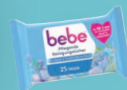
BEBE 5IN1 PFLEGENDE REINIGUNGSTÜCHER 25 Stk. Packung